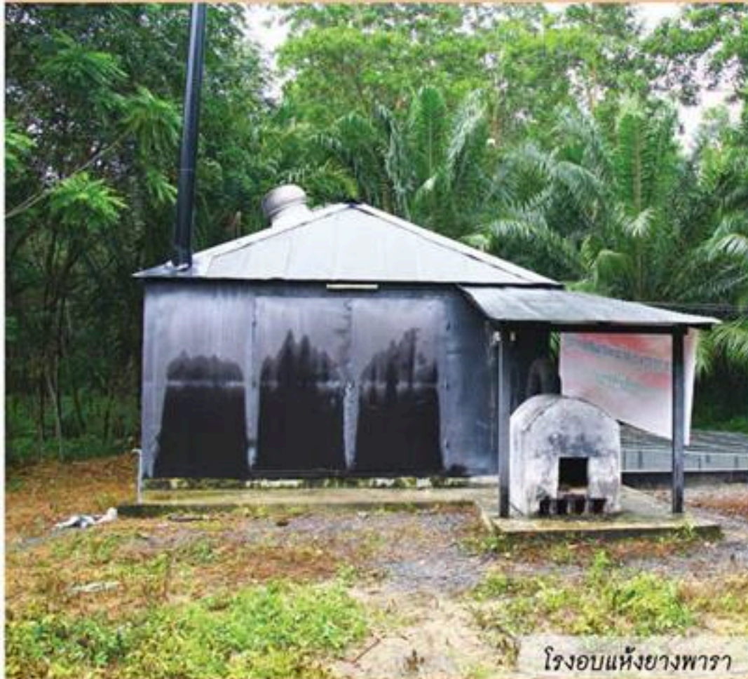
โรงเรียนแห่งปางพารา