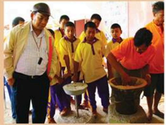
วิสาหกิจชุมชน ผลิตเตาหุงต้มประสิทธิภาพสูง