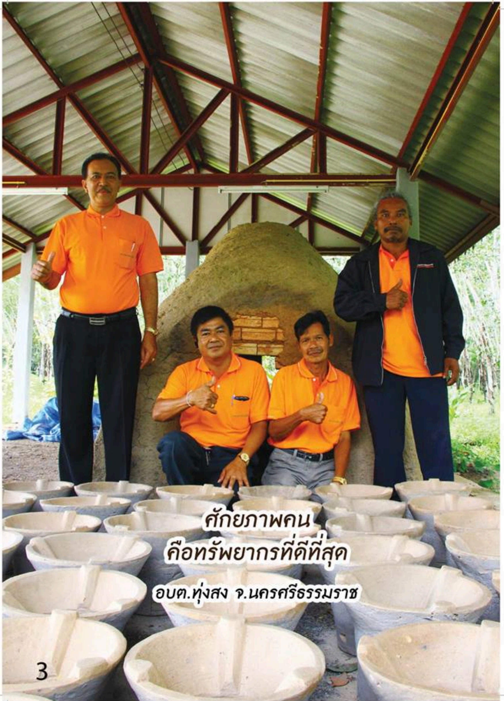
ศักยภาพคน คือทรัพยากรที่ดีที่สุด อบต.ทุ่งสง จ.นครศรีธรรมราช